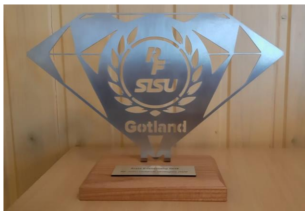
Äntligen! Årets evenemang 2019 Helg utan Älg

Kommittéberättelserna är upplagda med en kort Inledning . Därefter kommer Verksamhetsberättelse 2020 med de fastlagda punkter som kommittén beslutade att arbeta med under år 2020. Till varje sådan punkt följer en/flera strecksatser som visar vad som uppfyllts under året. Slutligen återfinns planerade insatser att arbeta med under detta år i punktform, Verksamhetsplan 2021 .