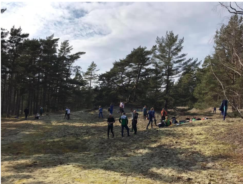
Fårölägret blev ett dagsläger med egen medhavd lunch