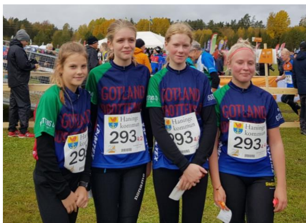
Några av hjältarna på 25-manna 2019