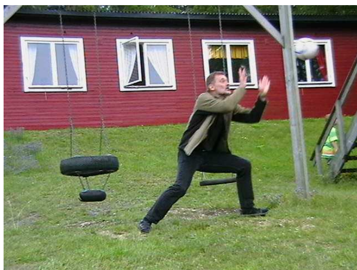
Ordföranden "in action" på Sommarfesten