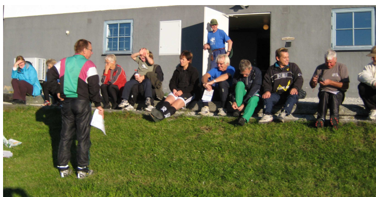
Kurserna är igång, vid första kurstillfället var deltagarna flest i vuxenkursen